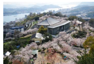
千光寺公園（尾道市）