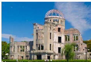
原爆ドーム（広島市）